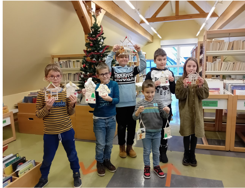
En haut: quelques enfants du village et leurs bricolages à la fête de Noël de la bibliothèque. Ci-dessous: le coin des petits prêt pour les Portes ouvertes.

Renseignements au 03 88 50 73 69 aux heures d'ouverture ou par email : Bibliothequerosenwiller@wanadoo.fr