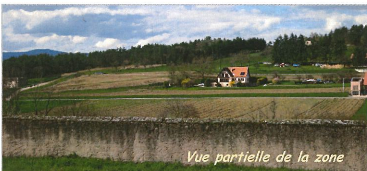
Vue partielle de la zone

Compte tenu de la durée des études et des délais administratifs incompressibles, les travaux de viabilisation du site devraient démarrer au printemps 2020.