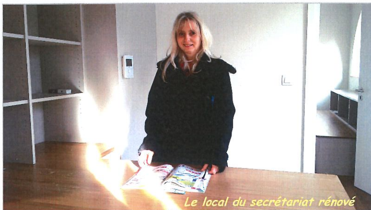
Le local du secrétariat rénové

La routine et l'ennui ? Elle ne les connaît pas ! Formée à la comptabilité, elle a travaillé à la Communauté de Communes de Molsheim-Mutzig avant de postuler pour le secrétariat de mairie de Rosenwiller. En complément des opérations de comptabilité, elle s'occupait du suivi des subventions, une tâche essentielle qui requiert des qualités d'organisation et beaucoup de minutie, ce qui allait s'avérer indispensable à son nouveau poste, exigeant en termes de faculté d'adaptation et d'art de la polyvalence.