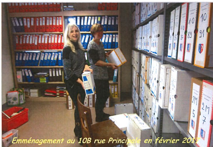
Emménagement au 10B rue Principale en février 2017

La structure intercommunale lui permet d'échanger avec ses collègues des autres communes et de faire partie d'un réseau d'aide réciproque qui s'avère indispensable au vu de la complexité de certaines situations.