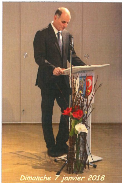
Dimanche 7 janvier 2018