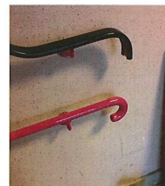
A l'école : escaliers sécurisés et rampes rallongées