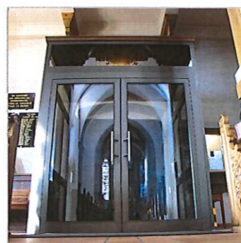
Sas d'entrée de l'église - vue de l'intérieur