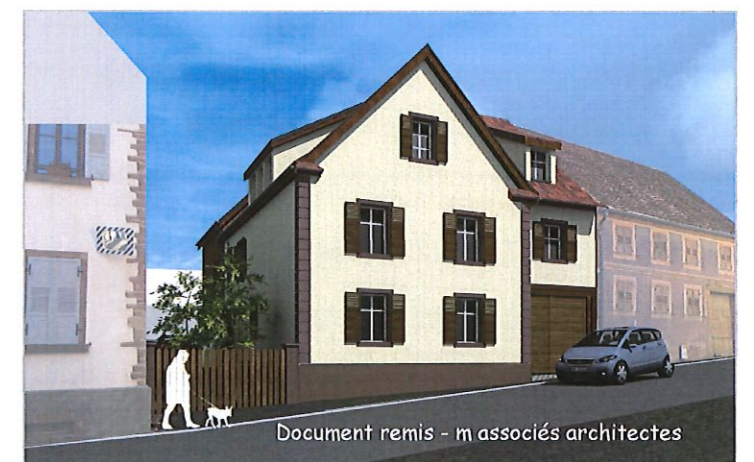
Esquisse du bâtiment achevé

Les travaux devraient commencer au courant de l'année. L'intégration dans le site respecte la typologie du bâti environnant.