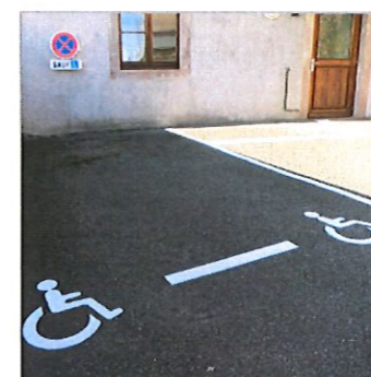
Place de parking aménagée dans la cour du presbytère